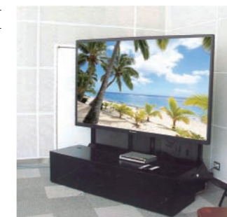
PMC-GL ボックスタイプ納入例

安全・確実に設置できるスタンドです。受注生産品につき設置するディスプレイに応じたカスタマイズも可能です。