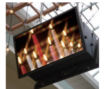
※画像は屋外タイプです