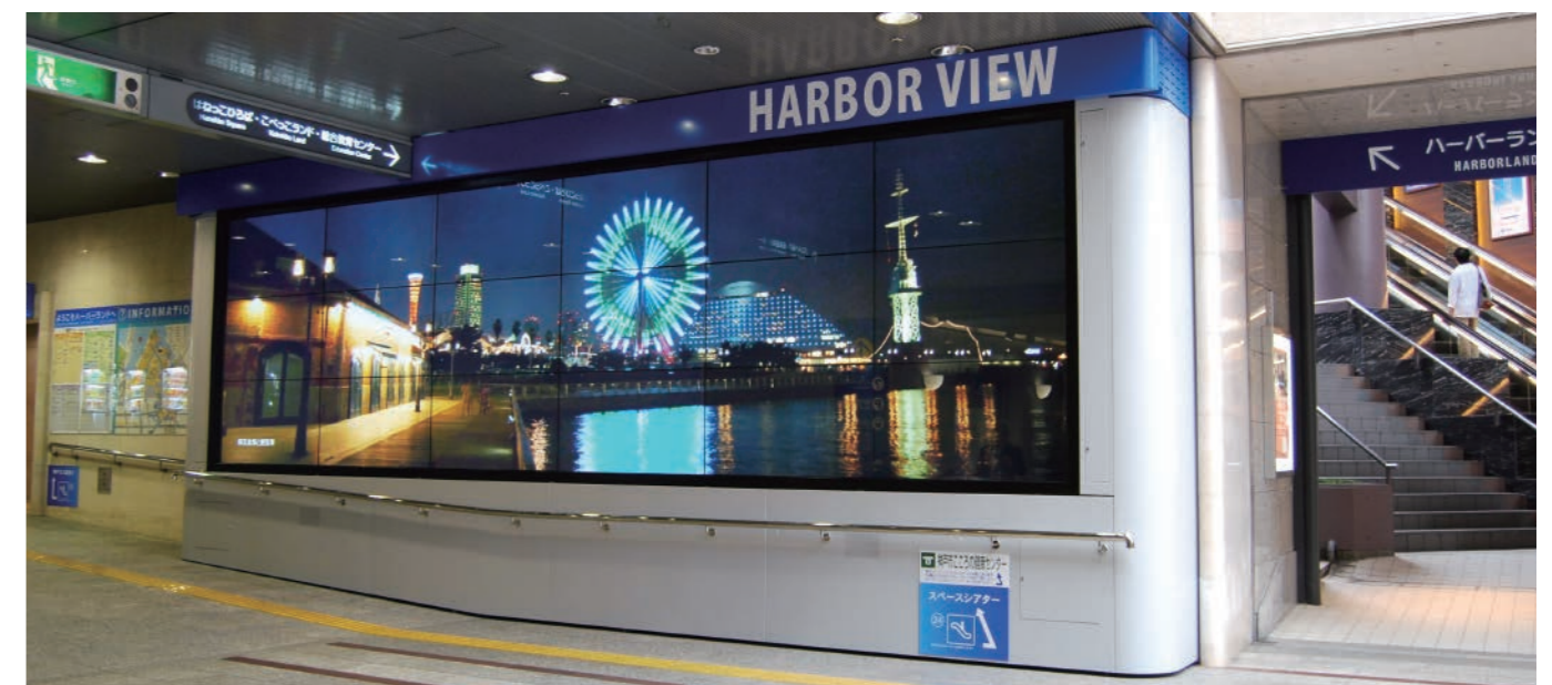
納入例：デュオこうべ様 180型(60型×18面)