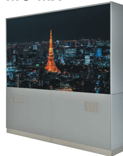
4面マルチディスプレイユニット (55型)