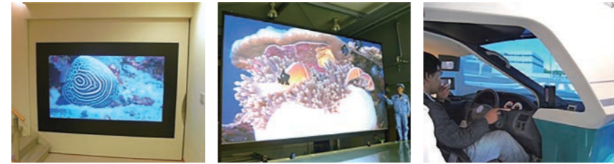
ホームシアター 200インチ シミュレーター