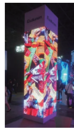
45度タイプを使用した場合