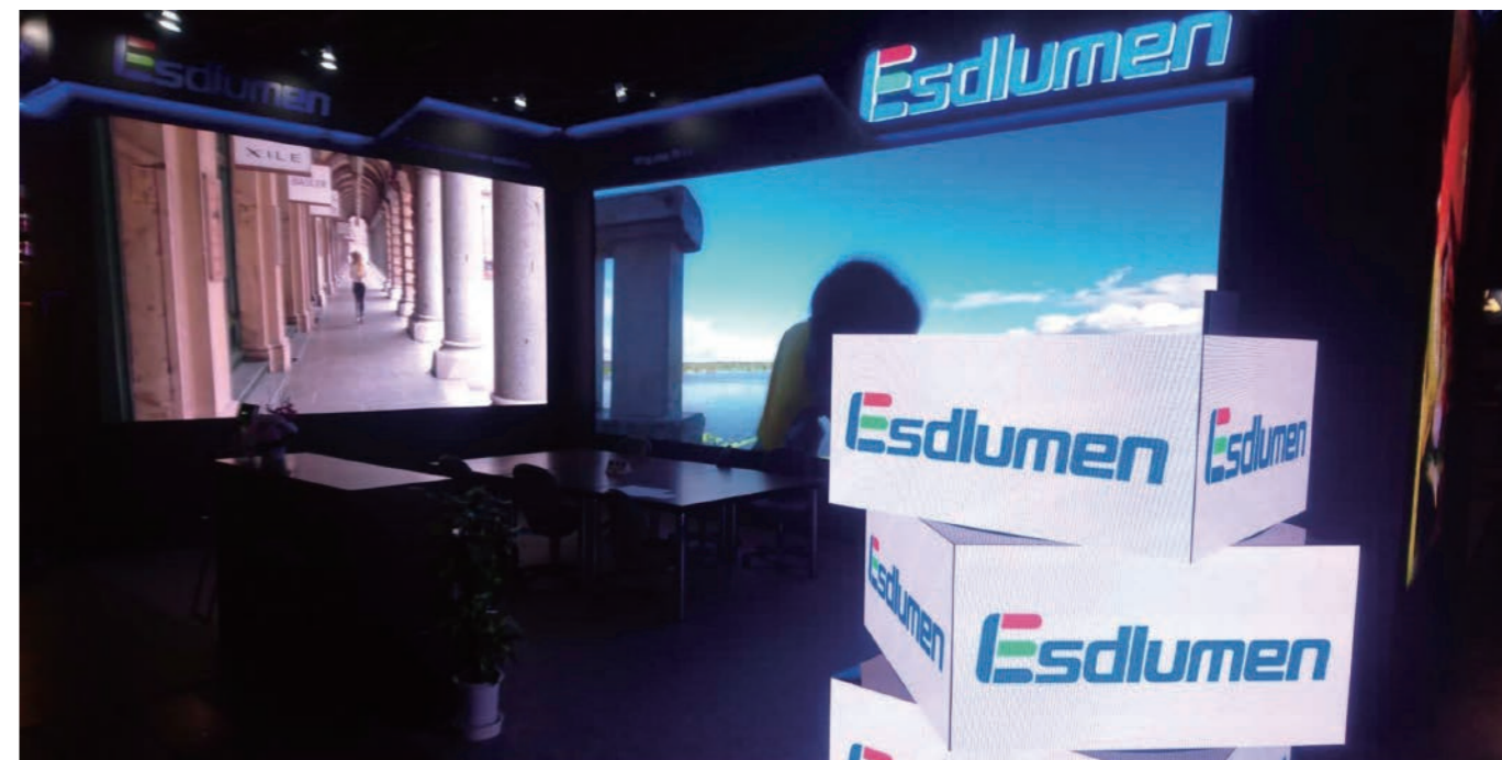
アピールが重要な展示会場でも、大画面で印象的な演出ができます。

ブラック LED チップを使用したパネルで、精細画像をコントラスト比の高い状態で再現。均一性の高いチップを選別して製造しているため、ムラのない映像を映し出します。