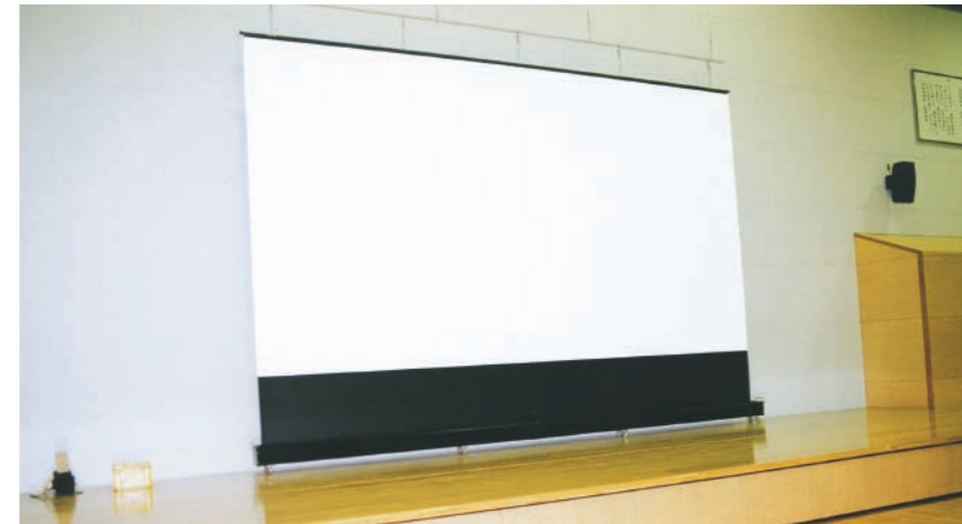
大型ロールアップスクリーン (電動ボタン駆動型)