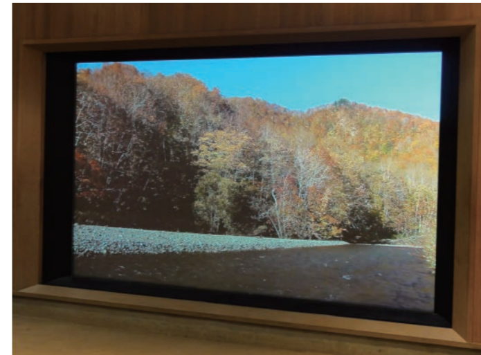
横綱千代の山・千代の富士記念館 様 (北海道松前郡福島町) クリアブラック精密裁断加工、パネルスクリーン

お客様のご要望に応じて、設置場所や用途を考慮した設計・製作をいたします。イベントや展示施設向けの3-D対応シルバースクリーンやシースルースクリーン、大型ロールアップスクリーン、大型張込式スクリーンも製作可能です。