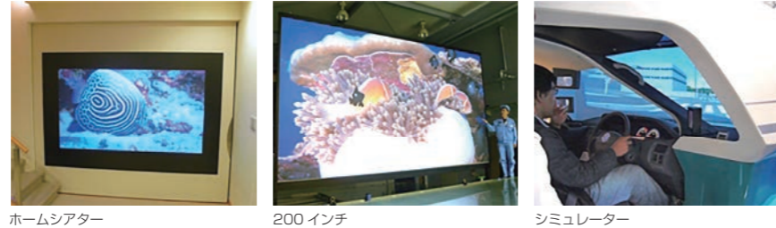
ホームシアター 200インチ シミュレーター