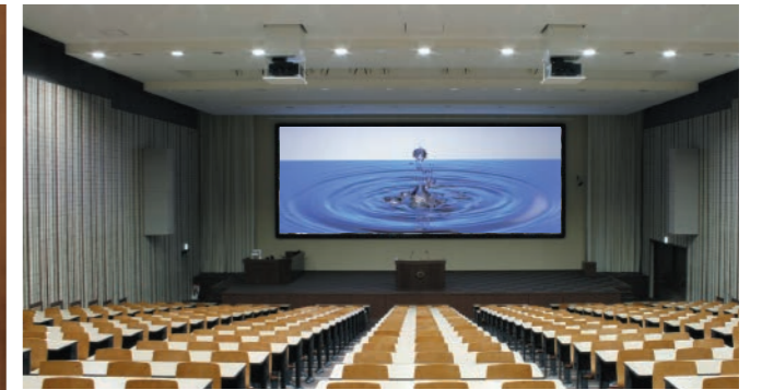
大型張込式スクリーン