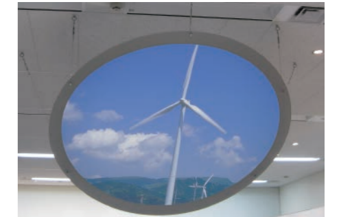
天井吊下げ特型リアスクリーン