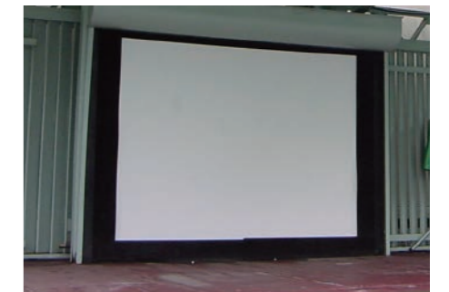
パブリックビューイング 屋外張込式スクリーン