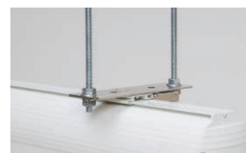
ボルト吊金具 ボルト吊金具にワンタッチスライド金具をつけてスクリーン本体を取り付けします。