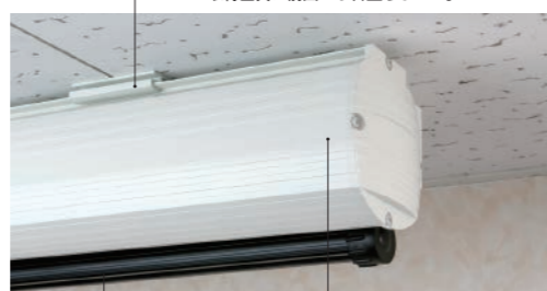
幕面シワの自動調整機能 アルミパイプ内部にテンションスプリングを内蔵。テンションスプリングにより適度なテンションで幕面をフラットに保ちます。 ケース色はホワイトを採用。デザイン性のあるケースで様々な環境に溶け込みます。