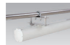
▲バトン吊金具(オプション)