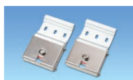
▲ワンタッチスライド式取付金具