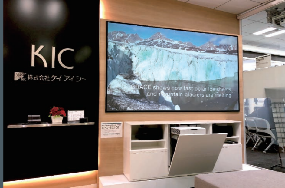
弊社 本社/東京支店受付 dnp LaserPanel™ キャビネット dnp ExecutiveClassic LPC-EC100W

スクリーンの意匠に調和した、デンマークデザインの木製キャビネットをご用意しました。洗練されたデザインは、役員会議室などに相応しい上質な空間を演出します。設置条件・機材・備品収納状況に応じてご選択ください。