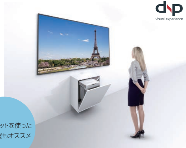
※キャビネットはオプションです。