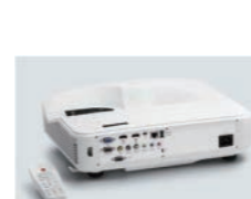
レーザープロジェクター (3000lm)