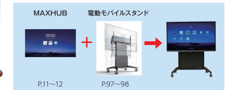
※取付モニターによって質量や高さが異なります。詳細はお問合せください。