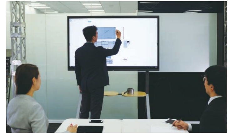
組合せ例：MAXHUB 65インチ +PS-HIT

PS-HIT(P95) なら、画面の近くまでスムーズに近付けるので、ミーティングボードの操作にストレスがありません。ディスプレイの微かな傾きも調整できるので、ベストな状態の打ち合わせを可能にします。