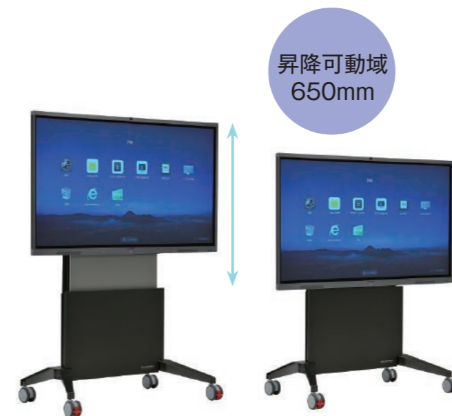
※画像は MAXHUB S シリーズです。

電動リモコンで昇降するサラマンダーモバイルスタンドとの組み合わせです。高さ調整が容易かつ、機能的で美しいデザインが特徴となっています。